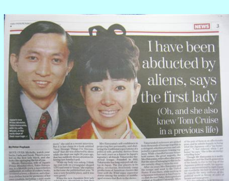
英紙インディペンデント（共同）